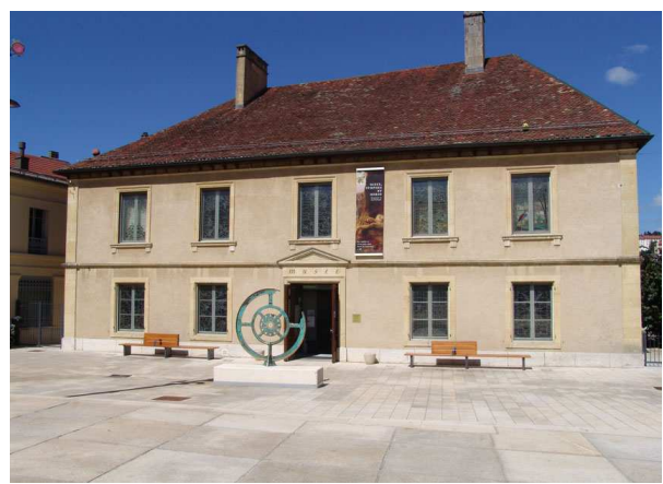
Musée de Pontarlier