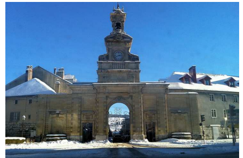
Porte Saint Pierre