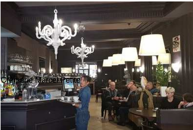
Brasserie La Poste