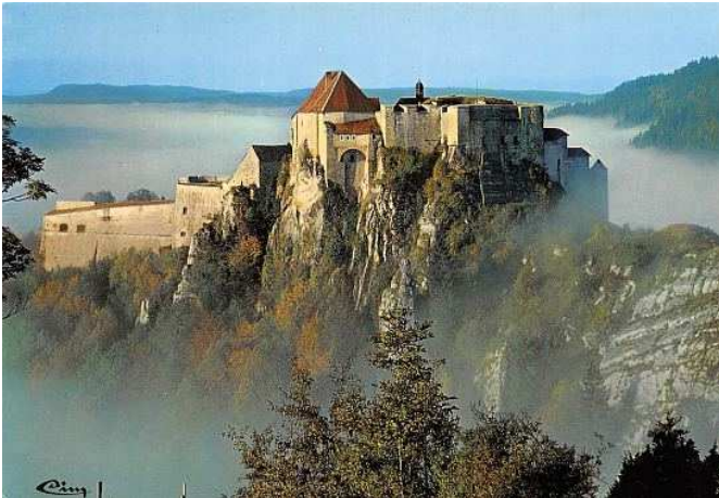
Château de Joux